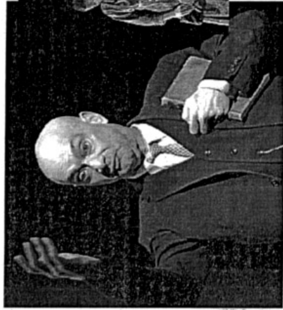
«L'uomo, la bestia e la virtù» al Don Bosco

Un fiume di applausi per «L'uomo, la bestia e la virtù», di Luigi Pirandello, per la regia di Enzo Vetrano e Stefano Randisi, portato in scena al cinema «Don Bosco» dalla compagnia «Teatro Stabile di Sardegna/Diablogues» nel cartellone «Teatri d'inverno» dell'Associazione Basilicata Spettacolo. Una farsa tragica che prende l'avvio dalla casa del professor Paolino, interpretato egregiamente da Enzo Vetrano, un uomo mite, onesto, rispettoso delle regole e della morale, che vive di lezioni private e che si innamora della madre di un suo alunno, la signora Perella, moglie di un brutale e fedifrago capitano che passa i suoi giorni in mare, di porto in porto. A rompere il fragile e precario equilibrio della vita del mite professore u-na gravidanza inattesa, che costringerà i due amanti a sfruttare l'unica notte che il capitano trascorrerà in casa per farlo assolvere, dopo avergli somministrato con l'inganno un potente afrodisiaco, i propri doveri coniugali, evitando così lo scandalo e la furia del mari-